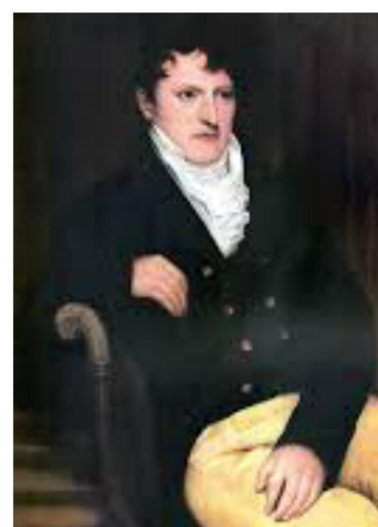
APORTE DE MANUEL BELGRANO A LA PROFESIÓN

El Quipu es otra muestra clara de la forma de llevar la contabilidad, en este caso utilizada por las culturas precolombinas en América.