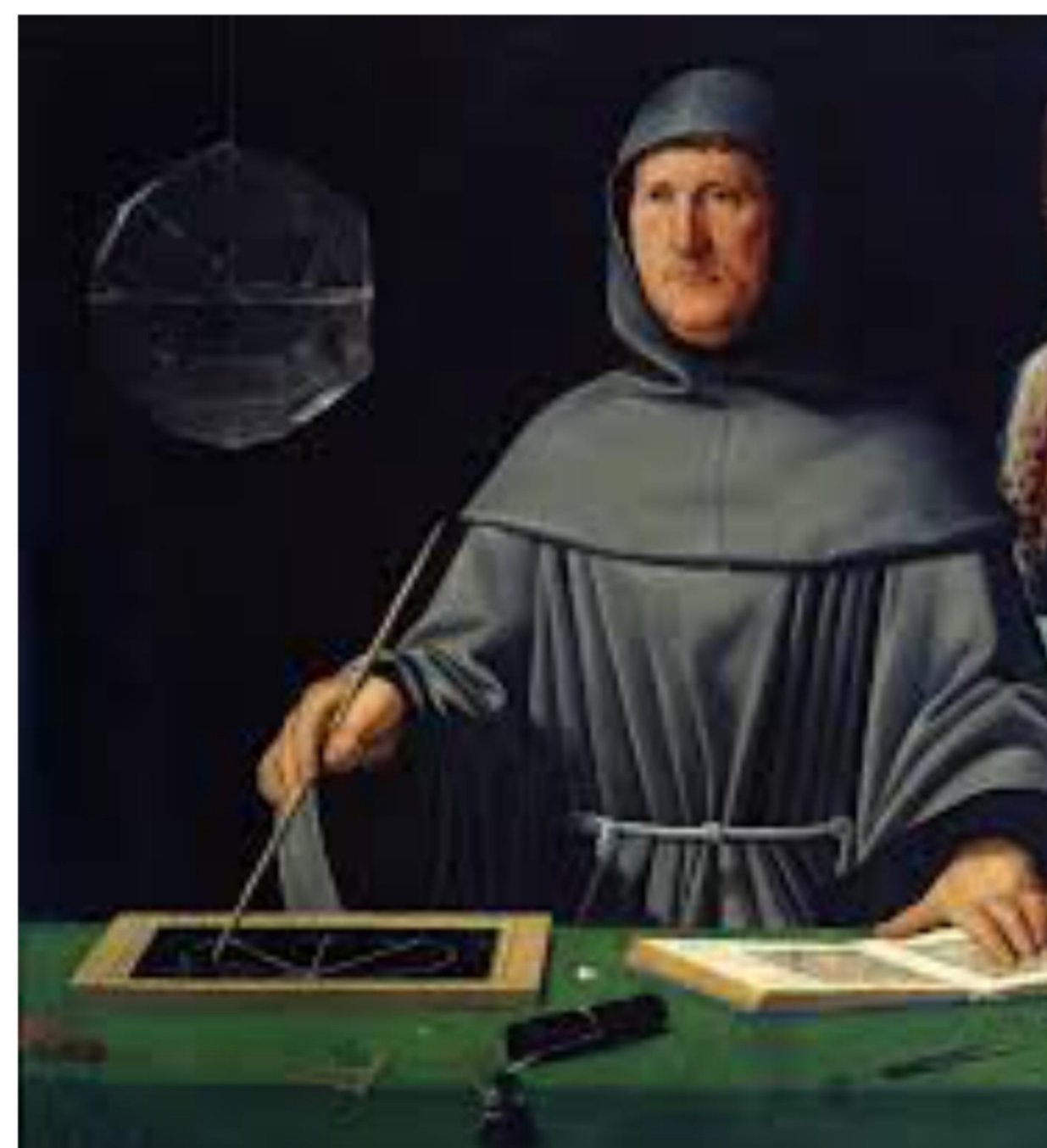
Benedetto Cotrugli (Rep de Ragusa 1416 - L'Aquila 1469)

El termino "Contabilidad" esta ligado al Matematico Luca Pacioli, autor del libro "Summa de Arithmetica, Geometria, Proportioni et Proportionalita" encontramos en el capítulo XI "Tractus XI- Particularis de computis et scripturis", el mismo compuesto de 36 capítulos donde se desarrolla su famoso principio de la "Partida Doble" y aconseja el uso de cuatro libros: Inventario y Balances, Borrador o Comprobante, Diario y Mayor.